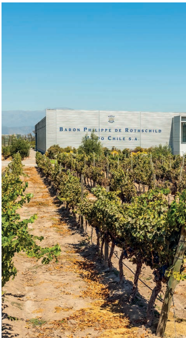
BARON PHILIPPE DE ROTHSCHILD CHILE